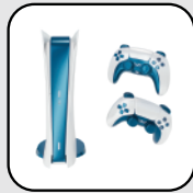
Consolas de video juego