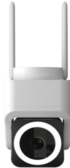
IMAGEN DEL PRODUCTO: